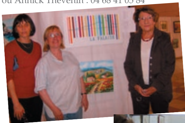
L'Atelier à Montredon

Vous pouvez nous joindre, à la MDA - Anne / Nelly au 04 68 42 81 76 ou Annick Thévenin : 04 68 41 05 84