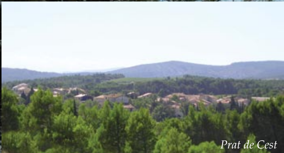
Prat de Cest